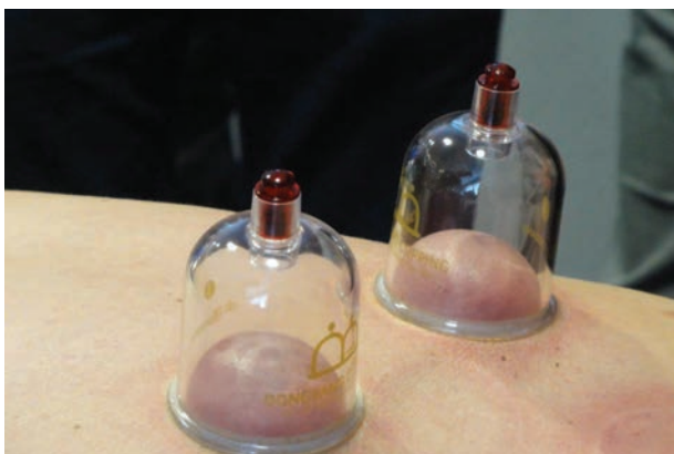
3. Handpomp cupping waarbij een duidelijke verkleuring op de rug zichtbaar is door de stagnatie. Deze verkleuring verdwijnt binnen drie tot vijf dagen.