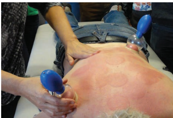
4. Cupping waarbij een duidelijke verkleuring optreedt door de stagnatie in het behandelde gebied. Verwijder de stagnatie en de pijn verdwijnt.

een vacuüm wanneer deze langzaam wordt losgelaten. De cups hebben verschillende maten, waarbij de in te zetten maat afhangt van het te behandelen lichaamsdeel. Gezichtscups zijn bijvoorbeeld heel klein en zacht en worden gebruikt in de anti-aging gezichtscuppingmassage.