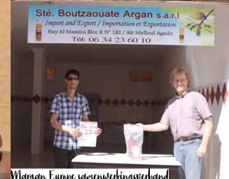
Margan Europe samenwerkingsverband