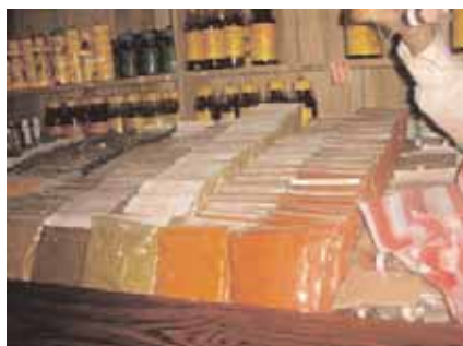
In de ayurveda wordt gebruik gemaakt van verschillende kruiden en oliën.

fen die zich in huid en spieren ophopen, afgevoerd. Het is dan ook altijd raadzaam een glas water of vruchtensap te drinken na afloop van de massage. De massage heeft effect op zowel ons lichamelijk als geestelijk evenwicht.