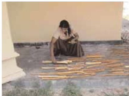
Kaneel wordt in de zon gedroogd. De olie wordt veel toegepast in de ayurveda.

De ayurvedische lichaamsmassage richt zich op het herstellen van de levensenergie in het lichaam. De massage wordt echter niet alleen ter behandeling toegepast, maar ook preventief ter voorkoming van een ziekte. Kenmerkend voor een ayurvedische massage is met name het ontspannen van het lichaam en behandelen van stress. Het lymfesysteem en de bloedcirculatie wordt hierdoor gestimuleerd. Tijdens de massage worden afvalstof-