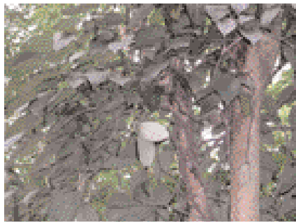
De groene peper, een liniaalplant, is een belangrijk specerij dat wordt gebruikt in de Ayurvedische kruidenoliën. Door het drogen van de groene peperkorrels ontstaat de zwarte peper.